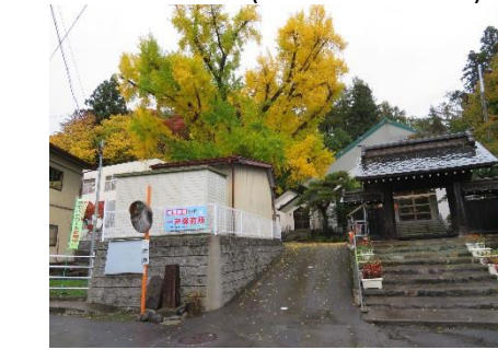
実相寺のイチョウ