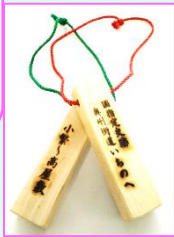
オリジナル通行手形(イメージ)

出発地「IGRいわて銀河鉄道」駅名入り「オリジナル通行手形」を参加者全員にプレゼント!!