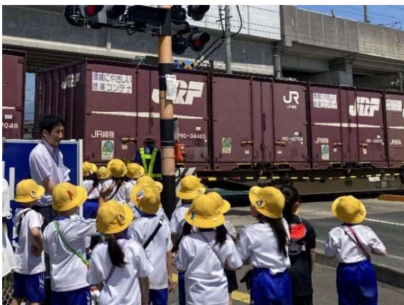
鉄道安全教室(青山駅) 2024年6月4・12・14日実施

また、8月1日に、盛岡駅改札前にカプセルトイ自販機を設置し、“わんこきょうだい”とコラボしたアクリルスタンドの発売を開始しました。盛岡さんさ踊りの時期に発売を開始したこともあり、大変好評をいただいています。