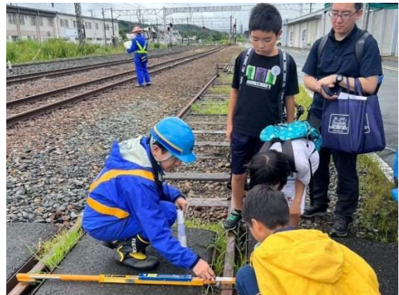
ぎんが列車 自由研究お助け隊 2024年7月27日・8月8日開催