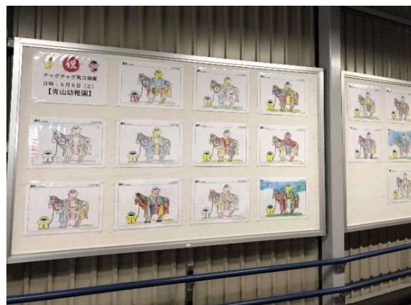
チャグチャグ馬コぬり絵掲出(青山駅) 2024年5月22日実施