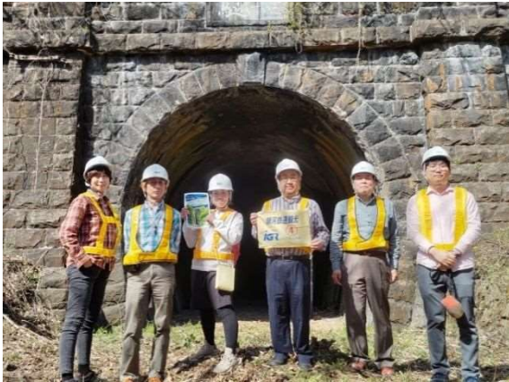
いわての鉄道遺構・廃線さんぽ(第1回) 2024年4月13日開催

また、県北地域から盛岡方面へ安心して通院できるよう、アテンダントが乗車してお客さまをサポートする IGR 地域医療ラインについては、アテンダントの確保が難しいなか、地域貢献の一環として継続して取り組んでいます。