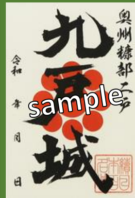
第四回 姉帯城 九戸城