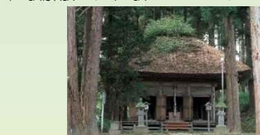
是川の清水寺観音(イメージ)