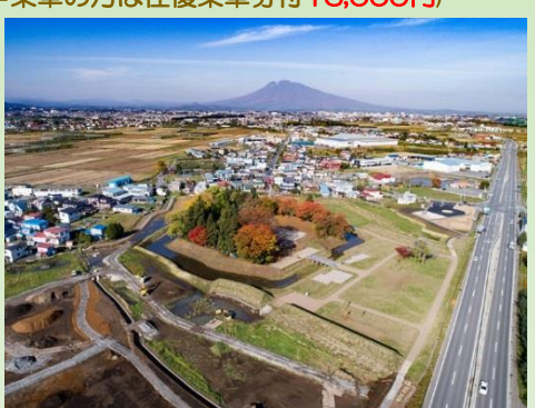
堀越城跡(イメージ)

【行程】凡例 +++鉄道(IGRいわて銀河鉄道) ===貸切バス(岩手県北バス) ……徒歩 (IGR盛岡駅7:32発+++ (IGR移動)+++8:36 IGR一戸駅着) 8:40 一戸駅集合 8:50一戸駅発===(貸切バス移動)=== 10:00 石川城 石川城の築城は南北朝期までさかのぼり、建武元年(1334)年には建武政府への反乱勢が「石川橋」に立てこもったとの記録がある。その後津軽を支配した安藤氏の勢力を南部氏が一掃し、天文2年(1533)年には南部高信が石川城に入城、津軽郡代として津軽を支配したとされる。しかし元龜2(1571)年5月、南部(大浦)為信(のちの津軽為信)が堀越城より急襲、高信は自害し石川城は落城した。その後、石川城に入った津軽家重臣板垣兵部は、慶長5(1600)の関ヶ原の戦いの時に反乱を起こしたものの、制圧され、石川城も廃城となったとされる。10:50===(貸切バス移動) 堀越城 建武3年(1336年)、北朝方の曾我貞光により「堀越橋」が築城されたとの記録が、堀越城の初出となる。その後も中世を通じて城館として機能していたと想定されているが、再び史料上に現れるのは南部(大浦)為信(のちの津軽為信)の「津軽切り取り」に際してである。元龜2年(1571年)、為信は堀越城から出立、石川城の南部高信を急襲した。その後為信は、津軽より南部氏の勢力を一掃、文禄3年(1594年)には堀越城を大改修して、大浦城から本拠を移転した。堀越城はその後、二代信枚が高岡城(のちの弘前城)を築城するまで、津軽氏の居城として機能した。 11:50===(貸切バス移動) 12:00 弘前市内(昼食) 13:00===(貸切バス移動) 13:40 高岡の森弘前藩歴史館・高照神社 14:40===(貸切バス移動) 15:20 浪岡城 16:20===(貸切バス移動) 18:20一戸駅解散 (一戸駅18:30+++ (IGR)+++19:33盛岡駅着)