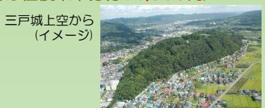
三戸城上空から (イメージ)

【行程】凡例 +++鉄道(IGRいわて銀河鉄道) ===貸切バス(岩手県北バス) ……徒歩 (IGR盛岡駅9:14発+++ (IGR移動)+++10:23 IGR二戸駅着) 10:30 二戸駅集合 10:40二戸駅発===(貸切バス移動)=== 11:00 三戸町城下町散策 ……12:30 三戸町内(昼食) ……(徒歩移動) 13:40 三戸城 伝承によると、16世紀の中頃、三戸南部家の拠点であった聖寿寺館跡(現南部町)から三戸に居城を移したと云われている。天正18年(1590)、豊田秀吉は、第26代南部信直に対して「南部内七郡」の領有を認め、同時に三戸城を正式な居城に定めた。その後、居城が福岡(現二戸市)に移転したのちも要害拠点として使用が続けられるが、寛永10年(1633)の盛岡城完成により、居城としての役目を終える。三戸代官所設置後は廃城となるものの、掃除奉行が任命され城の管理がなされていた。城内へは下馬門から入り、綱門→鳩門→櫓門→大門を経て本丸に至る。鳩門より本丸に向かう道の両側には重臣の屋敷が配置されていたという。本丸の東に位置する搦手門の一段下は、庭園空間となっており、更に東へ下がると城の裏口の鍛冶屋門に至る。 15:40===(貸切バス移動)===15:50道の駅さんのへ===17:10二戸駅解散 (二戸駅17:43+++ (IGR)+++18:52盛岡駅着)