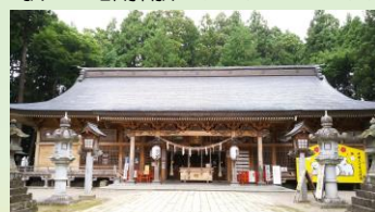
櫛引八幡宮(イメージ)

【行程】凡例 +++鉄道(IGRいわて銀河鉄道) ===貸切バス(岩手県北バス) ……徒歩 (IGR盛岡駅7:32発+++ (IGR移動)+++8:36 IGR一戸駅着) 8:40 一戸駅集合 8:50一戸駅発===(貸切バス移動)===9:30八戸駅集合合流9:45出発 9:50 櫛引八幡宮 櫛引八幡宮は南部家初代光行公の草創と伝えられる。10:50===(貸切バス移動) 11:10 小田八幡宮 中世は、「徳城寺」として新田家が建立した寺院で、棟札が残されている。11:50===(貸切バス移動) 12:00 八食センター(昼食) 13:00===(貸切バス移動) 13:15 根城(史跡根城の広場)・八戸市博物館 根城は、建武元年(1334年)に南部師行(なんぶもろゆき)により築城された城。寛永4(1627)年に領地替えにより使われなくなるまでの約300年間、八戸地方の中心。根城跡は、昭和16年に国史跡に指定。その後、昭和53年から約11年間掛けて、発掘調査及び整備事業が進められた。史跡の主要部分は、平成6年10月史跡根城の広場として公園化され、本丸跡には、発掘調査の成果をもとに、安土桃山時代の根城の様子が復原整備されている。 15:30===(貸切バス移動)=== 15:50 是川の清水寺観音堂 16世紀末の根城南部氏最盛期の南部地方唯一の中世建築 16:20===(貸切バス移動) 16:40一戸駅・一部解散 16:45===17:35一戸駅解散 (一戸駅17:48+++ (IGR)+++18:52盛岡駅着)