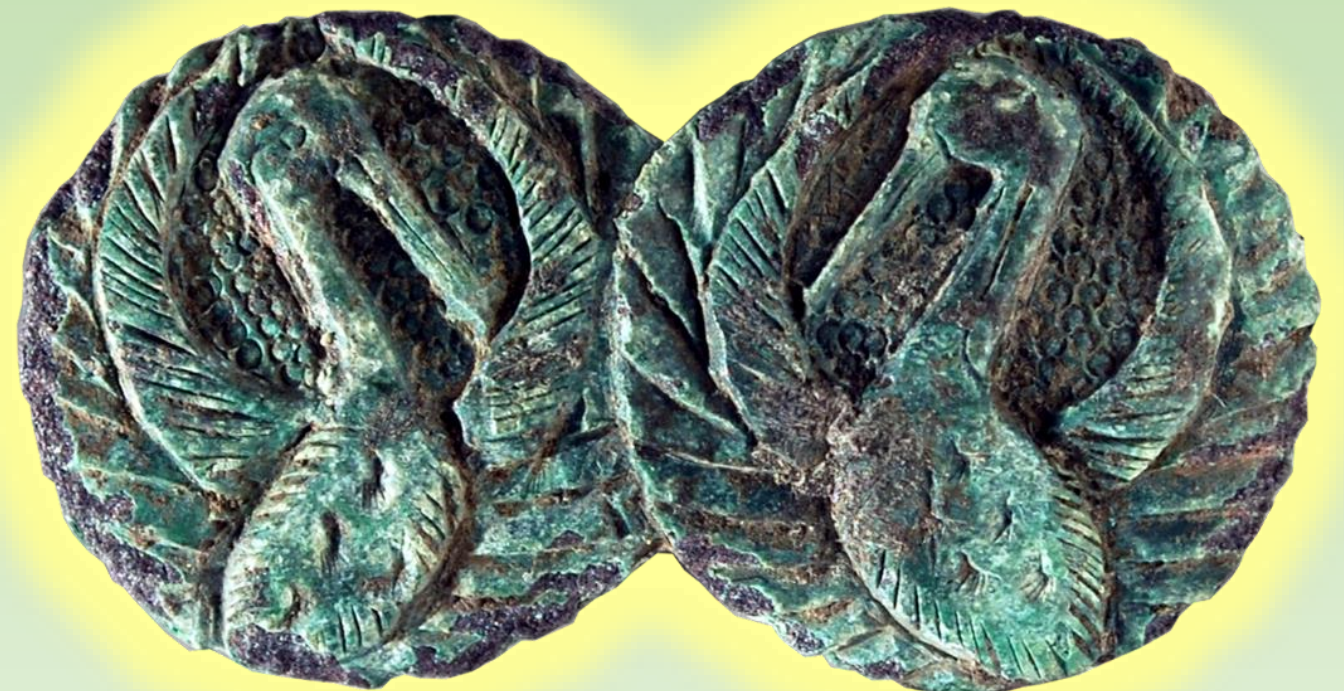
向鶴銅製品(聖壽寺館跡出土 南部町教育委員会蔵) (イメージ)