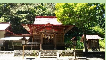
九戸神社(イメージ)