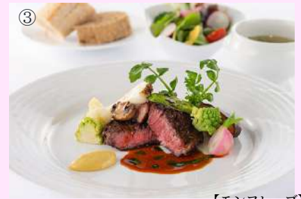
【モンフレーブ】 (イメージ)