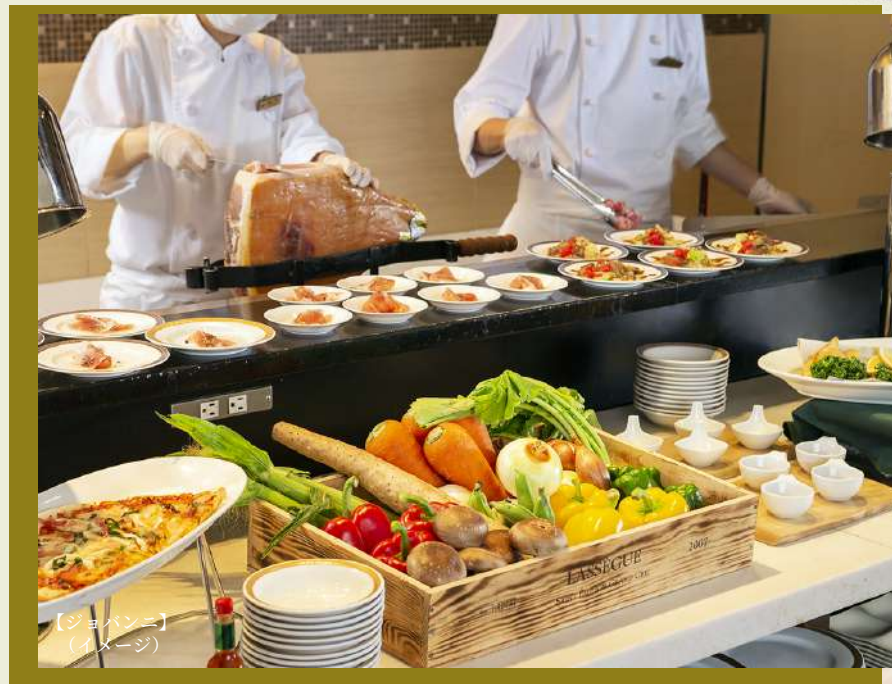
【ジョバンニ】 (イメージ)

【出発日】 いずれか1日 事前予約制 ★レストランの予約時間をお申込みの際お知らせください。 4月15日(金)～4月28日(木)