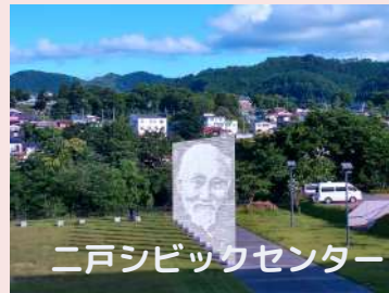
二戸シビックセンター