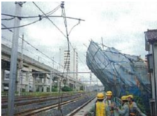
住宅建築用足場の倒壊による高圧配電線の切断事故